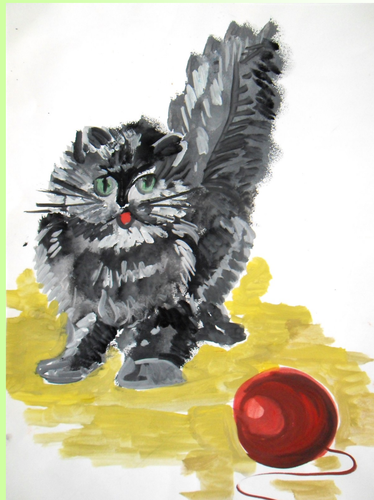
Шагаева Валерия 9 лет « Пушистик»

Серый котик - игрунок, Брошу я тебе клубок, Ты с клубочком поиграй, Мои нитки размотай!