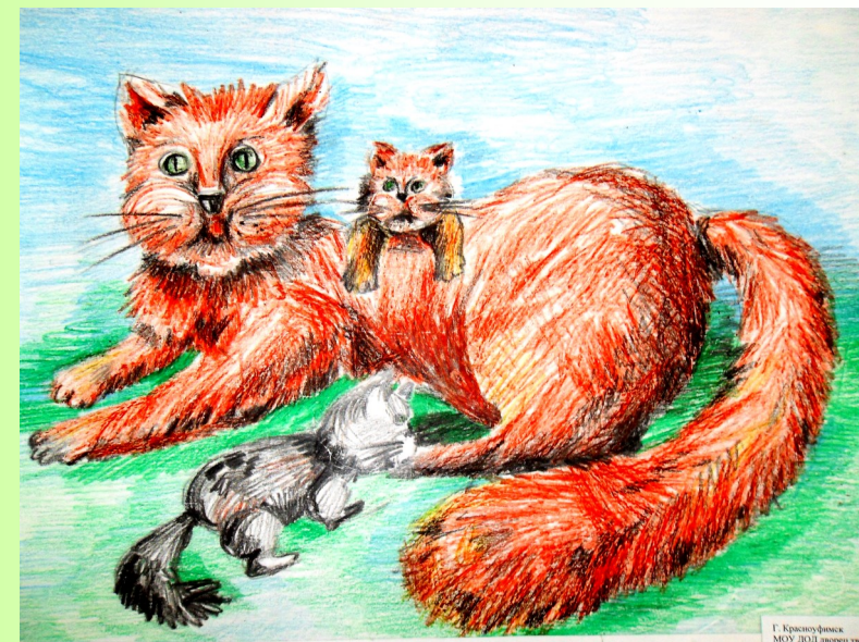
Васильев Алеша 9 лет «Веселое семейство»

Он озорной, веселый. Добрый и красивый. О любит играть, любит драться, валяться на чистом белье и спать на подоконнике. Кушает он только кошачий корм, любит мясо, колбасу выбирает по вкусу. Спит мой кот со мной, но только в ногах. Он самый умный, я очень его люблю.