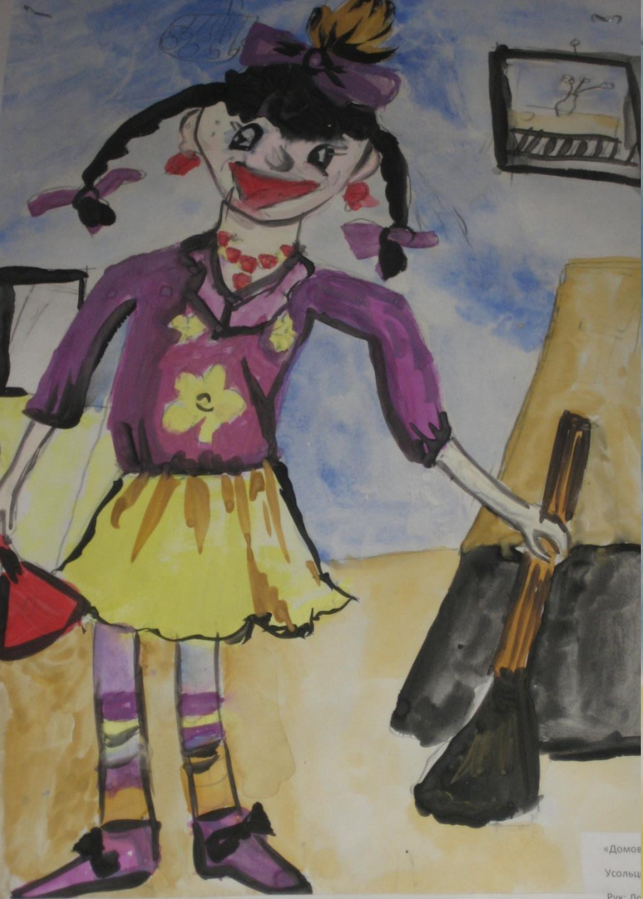
«Домов Усолиц Рук: Ле