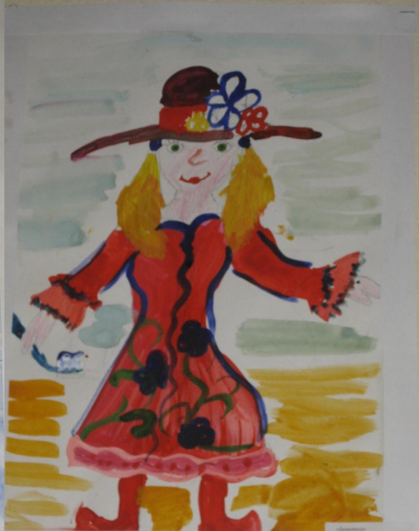
«Домовиха» Бережневская Галина 10 лет, 2002 Рис. Лубкина О.Г.