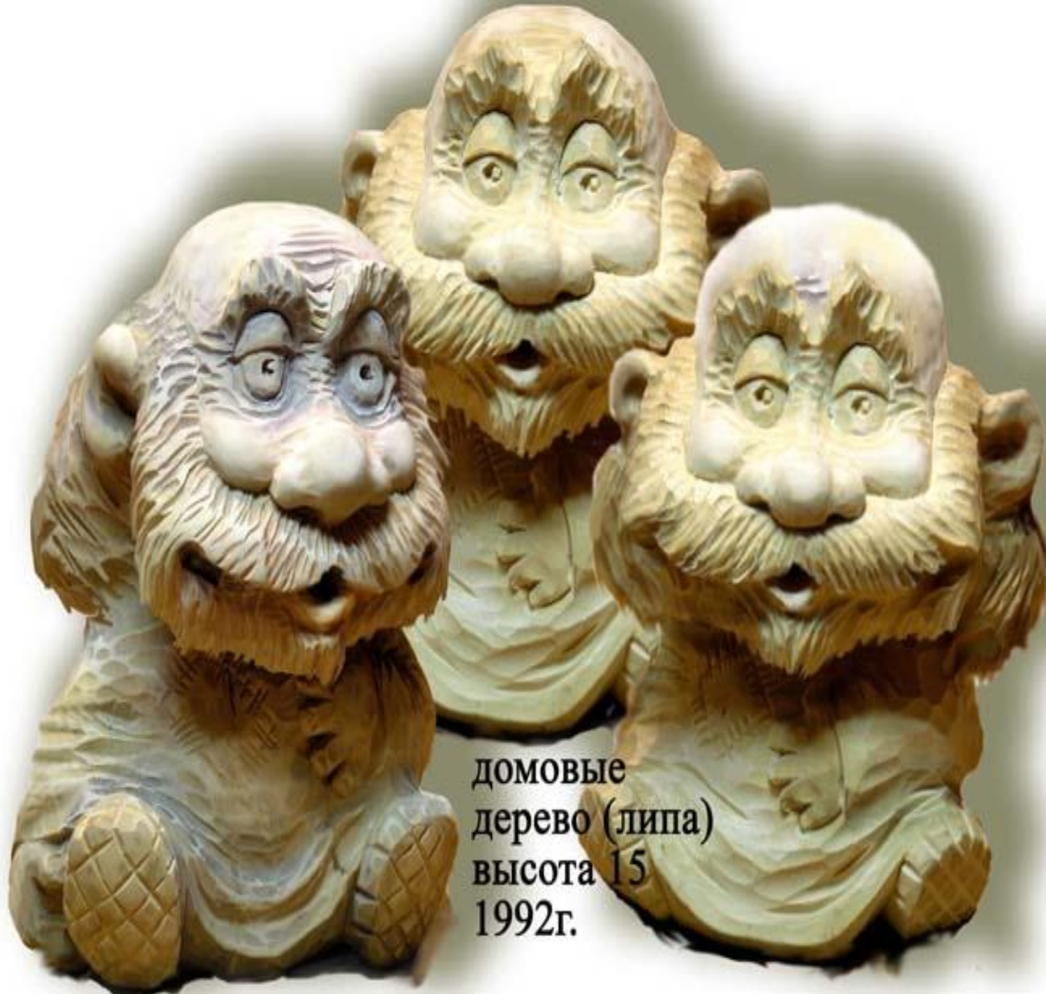
Домовые дерево (липа) высота 15 1992г.