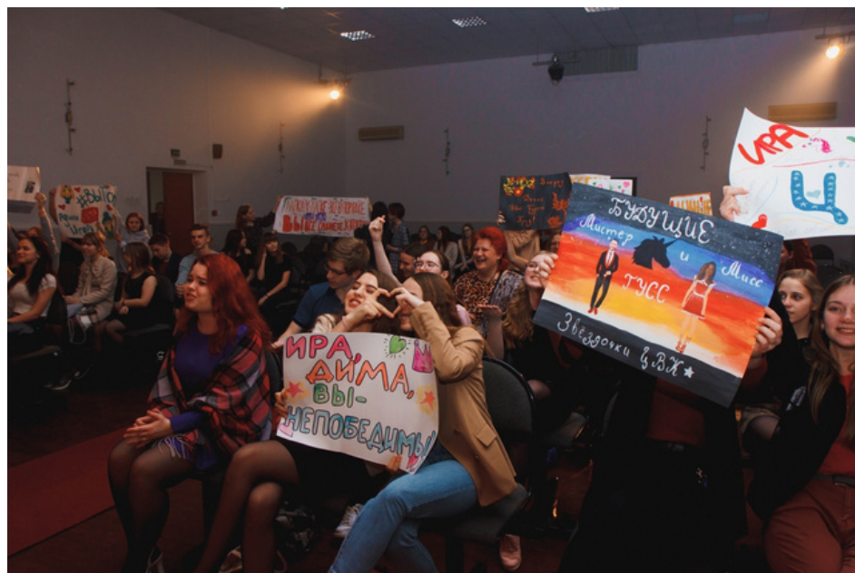
Мисс и Мистер ГУСС