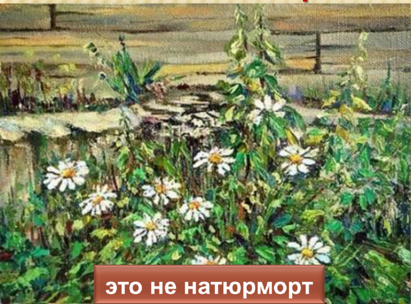
это не натюрморт

На моих работах изображены цветы. Какая из картин не является натюрмортом?