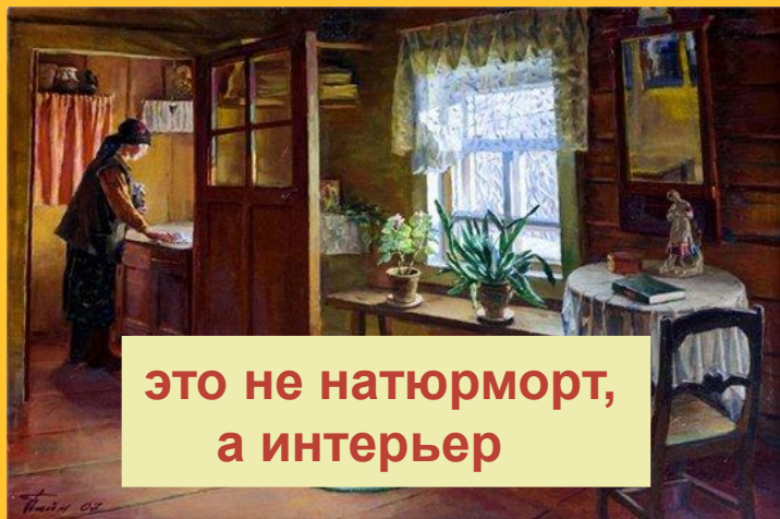
это не натюрморт, а интерьер