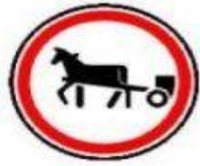
3.8 Движение гужевых повозок запрещено