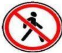
3.10 Движение пешеходов запрещено