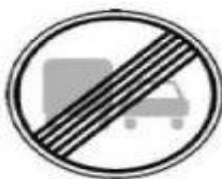
3.23 Конец запрещения обгона грузовым автомобилям