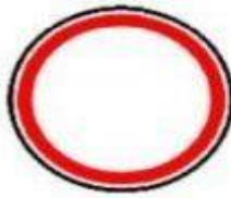
3.2 Движение запрещено