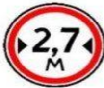
3.14 Ограничение ширины