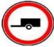
3.7 Движение с прицепом запрещено