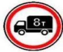
3.4 Движение грузовых автомобилей запрещено