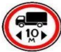
3.15 Ограничение длины