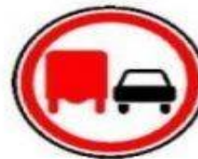
3.22 Обгон грузовым автомобилям запрещен