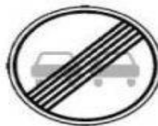
3.21 Конец запрещения обгона