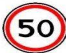
3.24 Ограничение максимальной скорости