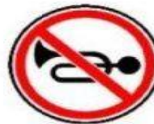
3.26 Подача звукового сигнала запрещена