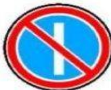
3.29 Стоянка запрещена по нечетным числам месяца