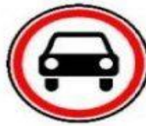
3.3 Движение механических транспортных средств запрещено