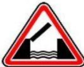
1.9 Разводной мост