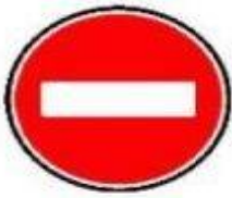
3.1 Въезд запрещен