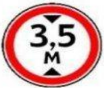
3.13 Ограничение высоты