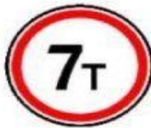
3.11 Ограничение массы