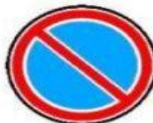
3.28 Стоянка запрещена