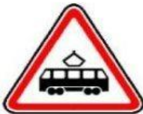
1.5 Пересечение с трамвайной линией