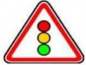
1.8 Светофорное регулирование