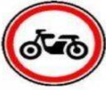
3.5 Движение мотоциклов запрещено