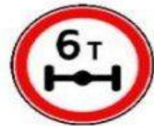
3.12 Ограничение массы, приходящейся на ось транспортного средства