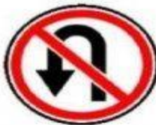
3.19 Разворот запрещен