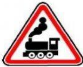
1.2 Железнодорожный переезд без шлагбаума