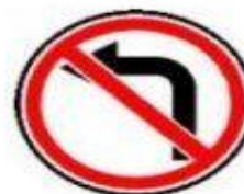
3.18.2 Поворот налево запрещен