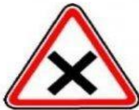
1.6 Пересечение равнозначных дорог