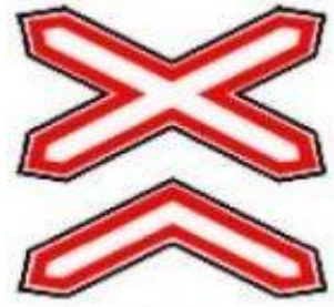
1.3.2 Многопутная железная дорога