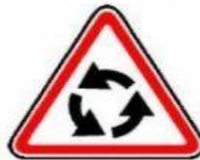
1.7 Пересечение с круговым движением