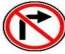
3.18.1 Поворот направо запрещен