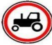
3.6 Движение тракторов запрещено