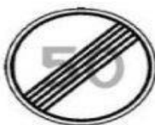
3.25 Конец ограничения максимальной скорости