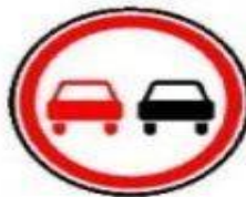
3.20 Обгон запрещен