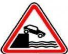
1.10 Выезд на набережную