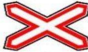
1.3.1 Однопутная железная дорога