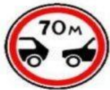
3.16 Ограничение минимальной дистанции