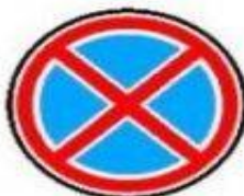
3.27 Остановка запрещена