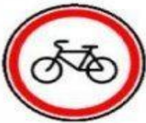
3.9 Движение на велосипедах запрещено