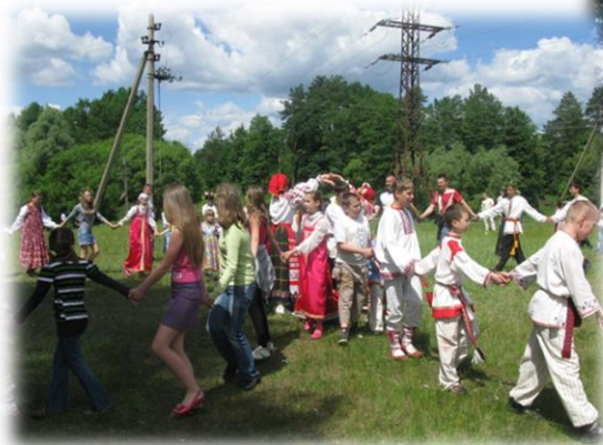
Праздничная служба Концерт для прихожан и детей лагерей, детского санатория