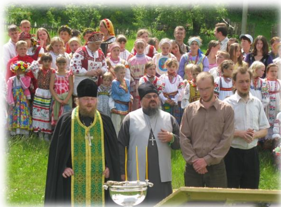
Водосвятный молебен у стен монастыря