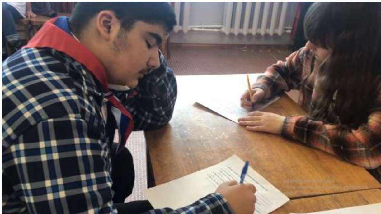
Фото 3. Анкетирование школьников.

По результатам анкетирования, мы выяснили, что многие ребята имеют желание приносить пользу обществу. Но есть и такие, которые не очень уверены в себе, и боятся, что им не хватит терпения учить. Радует, что среди ребят есть желающие потратить свое свободное время на общение и обучение жителей округа.